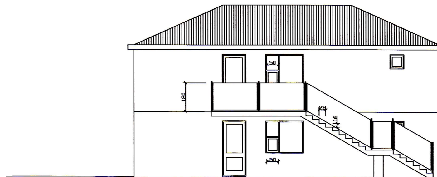
útlit norður mkv 1:100