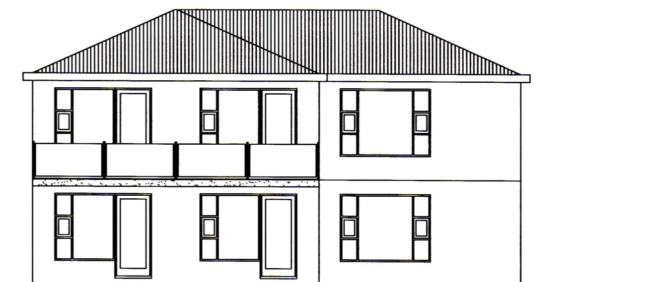
útlit suður mkv 1:100