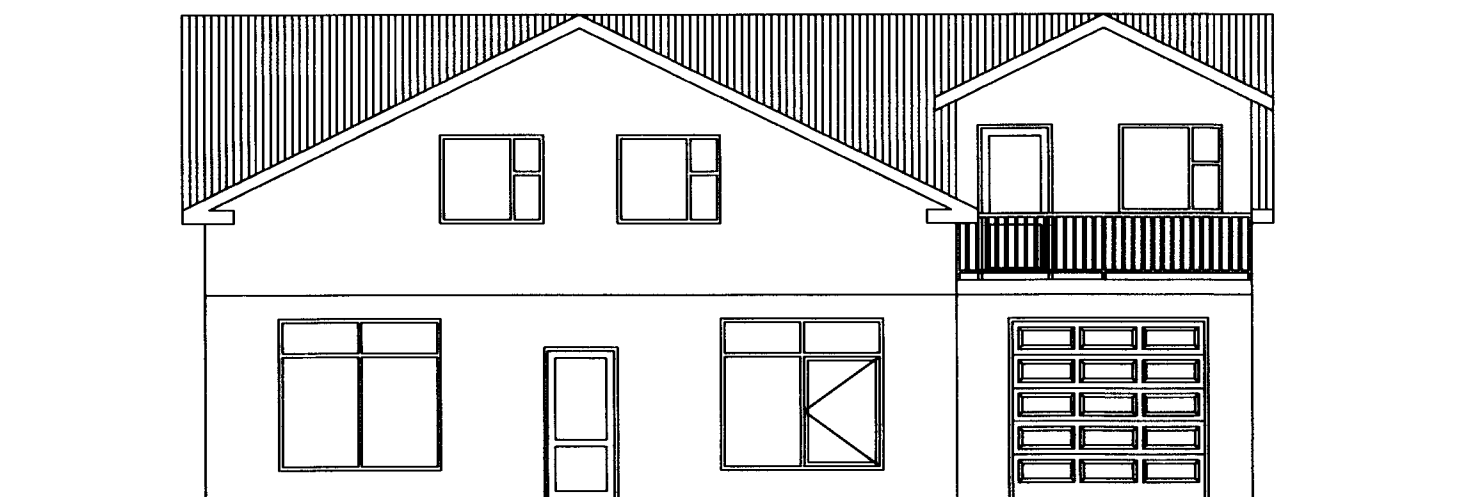
útlit suður mkv 1:100